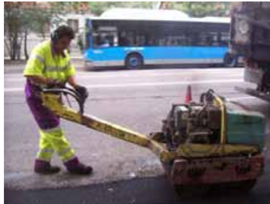
Fig.93. Ejemplo de uso de equipo de compactación de tamaño y diseño adecuado a lugares inaccesibles para los rodillos compactadores.

Los equipos de trabajo es importante se adecuen a las características de las zonas a actuar.