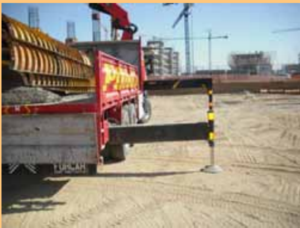
Fig. 18. Gatos estabilizadores apoyados en superficie horizontal