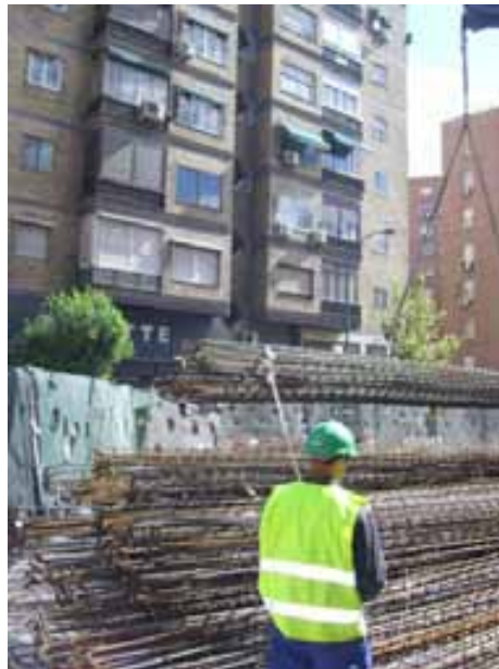
Fig. 57. Manejo de material mediante cabos de gobierno

En relación con estas dos unidades de obra hay que indicar que las mismas consideraciones preventivas indicadas en la ejecución de pantallas son trasladables a la ejecución de pilotes.