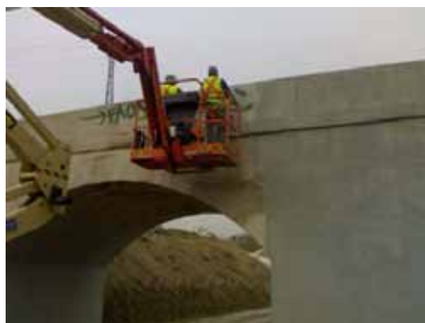
Fig. 103. Trabajos de pintura. Plataformas elevadoras para trabajos en altura.