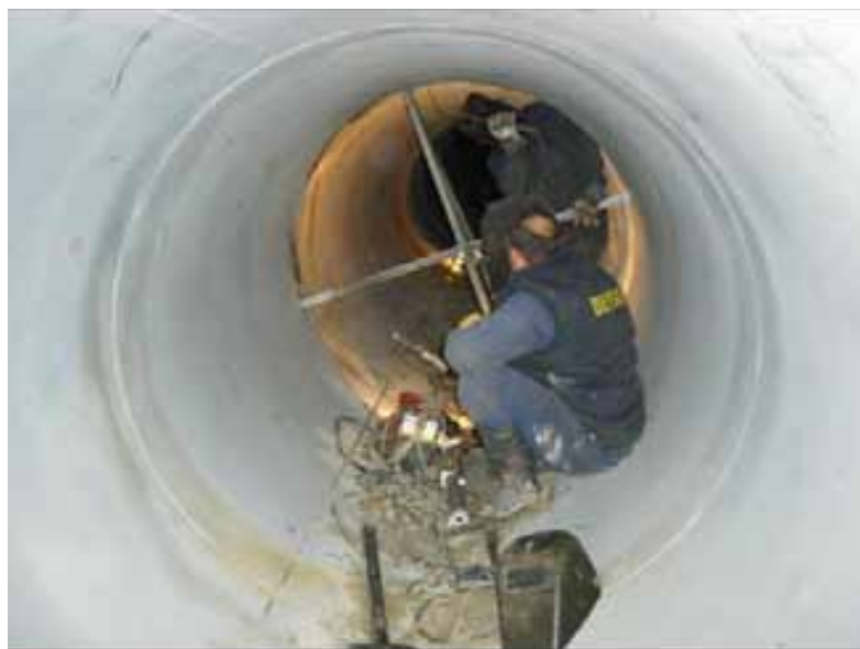
Fig. 31. Trabajos de soldadura en el interior de un espacio confinado.