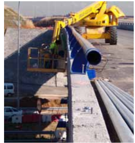
Fig. 83. Distintos trabajos en altura realizados mediante plataformas elevadoras.