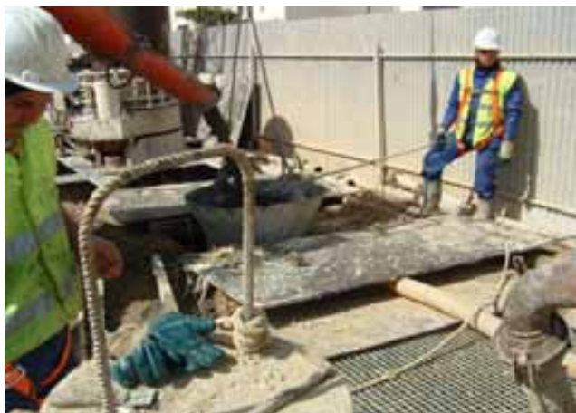
Fig.42. Punto fijo de hormigón; ejecutado rellenando bidón metálico.