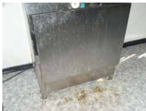
Fig. 5. Vista de aseo químico, instalaciones de higiene y bienestar y calienta comidas.