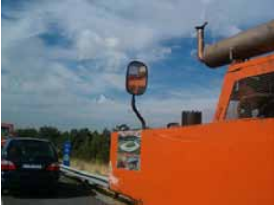
Fig.91. Espejo de apoyo de maniobras y avisador acústico de marcha atrás