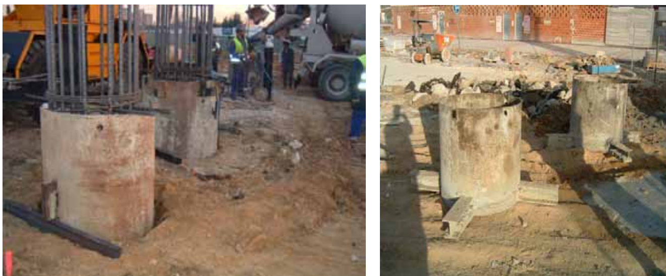
Fig. 55. Brocales y apoyos para mantener su posición durante la excavación