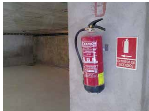
Fig. 3. Extintor y botiquín de primeros auxilios dispuestos en obra o vehículo