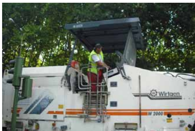
Fig. 99. Barandilla de protección en extendedora

Todas las plataformas de estancia o para seguimiento y ayuda al extendido asfáltico, dispondrán de barandillas tubulares en prevención de las posibles caídas, formadas por pasamanos de 90 cm de altura, barra intermedia y rodapié de 15 cms.