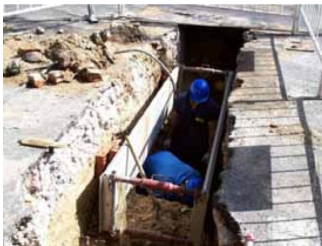
Fig. 28. Ejemplos de entibación.