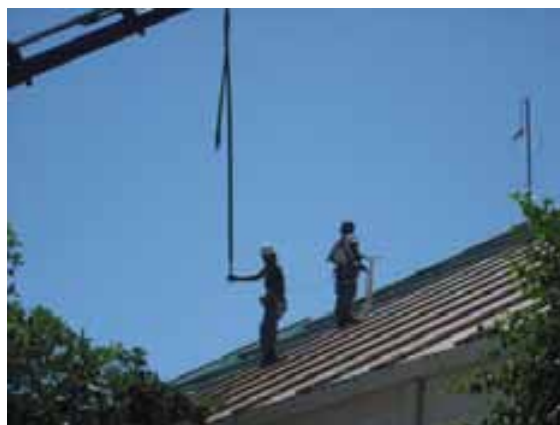
Fig. 72. Montaje de cubierta mediante línea de vida y arnés de seguridad.

En los trabajos de montaje y desmontaje de cubiertas es importante prever y disponer con anterioridad al inicio de los trabajos la protección perimetral (redes bajo cubierta, barandillas...), mediante plataforma elevadora. En caso de imposibilidad técnica justificada de disponer una protección colectiva, se instalarán líneas de vida de resistencia garantizada a las que anclarse los trabajadores mediante arnés de seguridad, planificando previamente la disposición de la línea de vida o punto fijo y el dispositivo anticaídas o similar a utilizar.