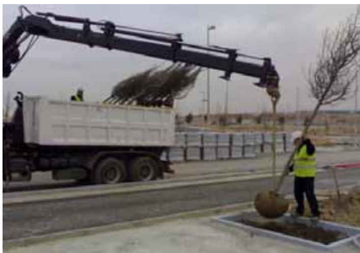
Fig. 105. Delimitación de acopio de árboles y uso de medios auxiliares para la plantación de árboles