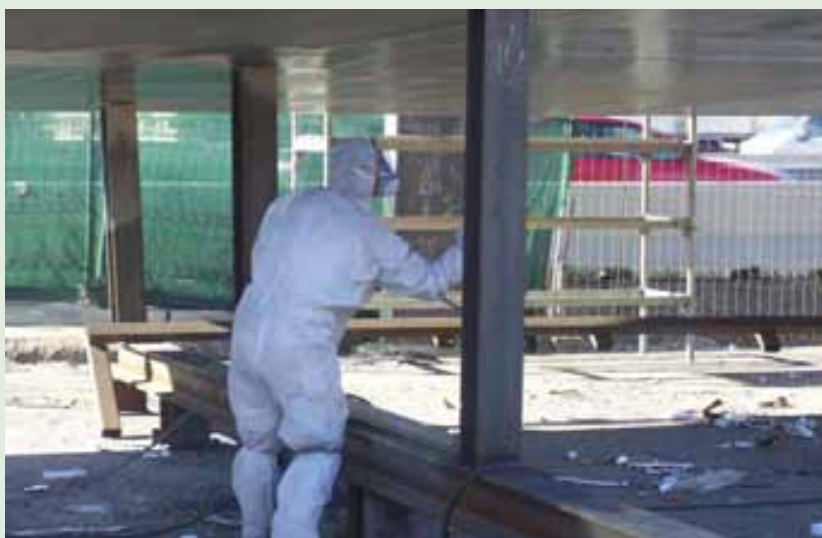
Fig.111. Utilización de equipos de protección individual