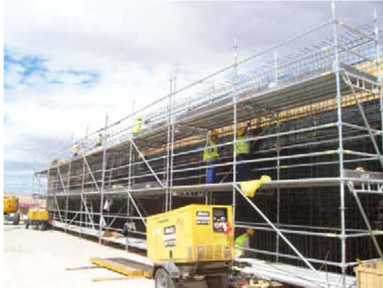
Fig.62. Montaje de ferralla de muro mediante el uso de andamios.

En general, se recomienda que las distintas armaduras se realicen en fábrica, evitándose disponer en obra de maquinaria para el doblado y corte del hierro así como la realización de trabajos en altura de manera continua (ferrallado de un muro). En estos casos, se deben planificar los trabajos de izado y de desenganche del mismo, con el correspondiente medio auxiliar (plataforma elevadora).