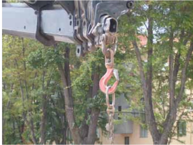
Fig. 114. Gancho con cierre de seguridad.

Para el izado, carga y descarga es necesario que se utilicen los útiles apropiados, tales como uñas especiales, piezas de apriete, etc., que deberán proporcionarlas el fabricante o transportista.