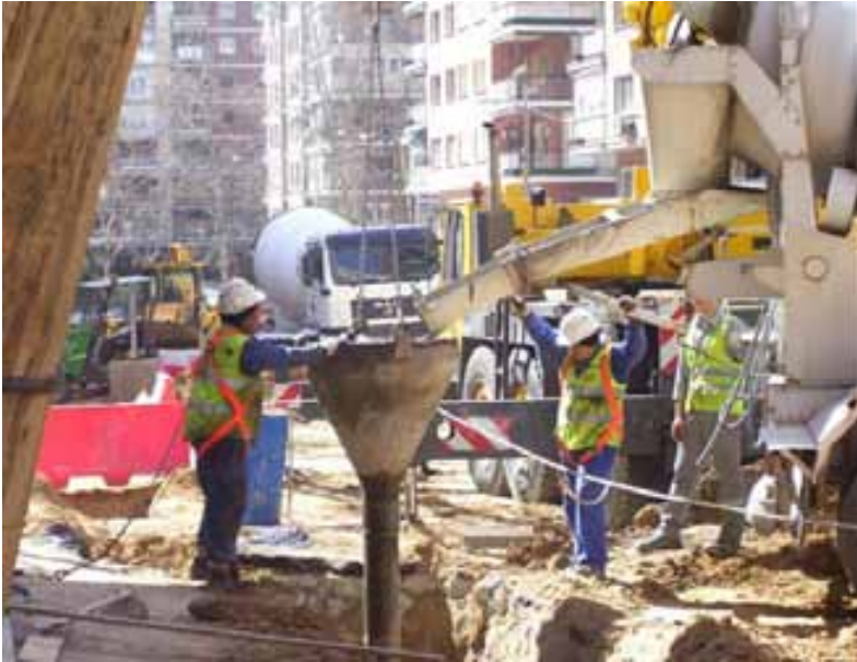
Fig. 43. Diversos enganches en la fase de hormigonado