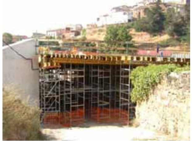
Fig.13. Cimbrado y protecciones de losa en paso inferior y en viaducto.