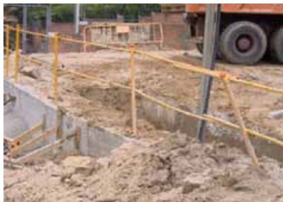
Fig. 46. Barandilla en murete guía. Excavación con pantalladora de cable enrollable y guía.

- La colocación de estas barandillas es operativa cuando se utilizan pantalladoras de bastidor rígido o de cables dentro del un bastidor rígido. El trabajador que realiza la medición de la profundidad del bache lo realizaría desde detrás de las barandillas del lado opuesto de la pantallador