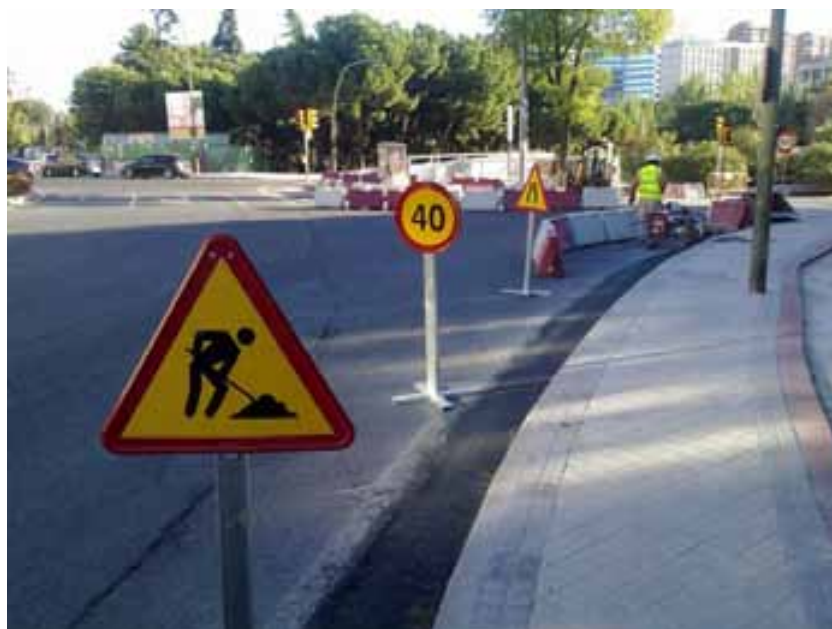
Fig. 36. Señalización de obra en vía pública.

Para evitar las afecciones ocasionadas por el tráfico rodado de vehículos, es necesario que previamente al inicio de los trabajos se instalen las medidas de señalización y balizamiento correspondientes en función de la zona ocupada de la calzada.