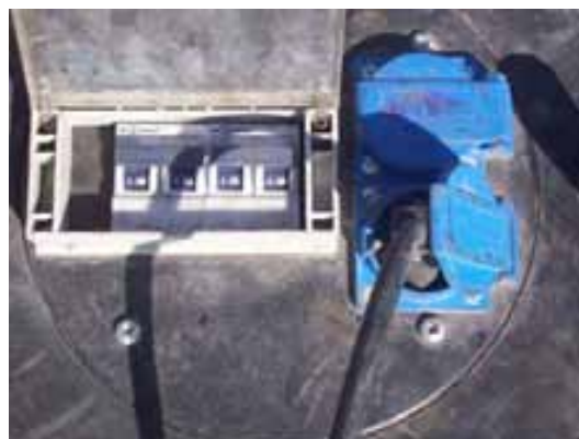
Fig. 85. Conexión de diferenciales y toma de tierra del grupo

◆ Según las condiciones de trabajo deberán utilizarse los siguientes equipos de protección individual :