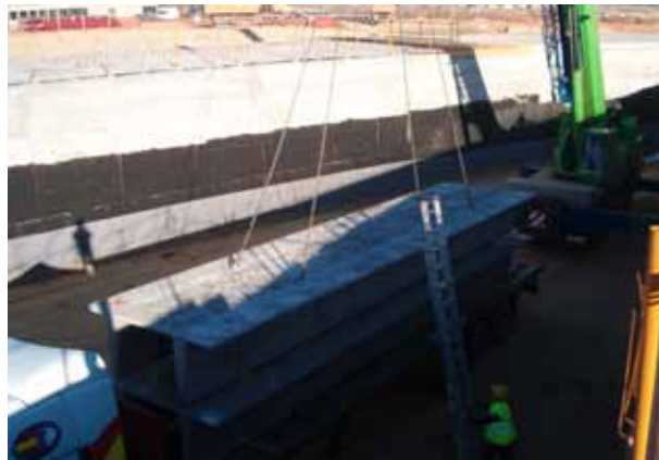
Fig. 79. Puntos de amarre previstos por el fabricante para el amarre.

También es importante que en el caso de vigas prefabricadas estén previstos los puntos de enganche de las mismas para su izado, los cuales serán los indicados por el fabricante que los habrá calculado para garantizar su resistencia y estabilidad.