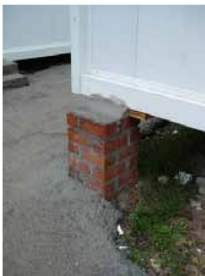
Fig. 4. Apoyo sólido y estable de fábrica de ladrillo

Posteriormente, ya en la fase de ejecución de obra las instalaciones de higiene y bienestar es importante se adecuen a las características de la misma, a su dispersión y número de trabajadores y contarán, según proceda en cada caso, con hornos calienta comida, ventilación suficiente, calefacción, y condiciones adecuadas de higiene y limpieza. En casos debidamente justificados se podrá contar, previa comprobación de tal disponibilidad, con medios externos existentes en el entorno próximo de las obras.