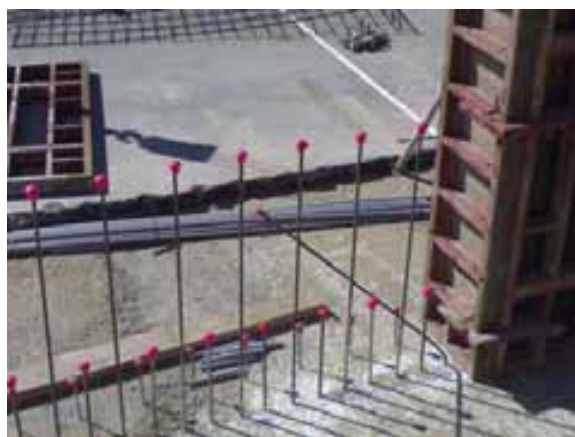
Fig. 63. Ejemplos de protección de esperas.

El acceso y las zonas de trabajo de ferrallado deben encontrarse protegidas previamente con protecciones colectivas para evitar el riesgo de caída en altura si es preciso.