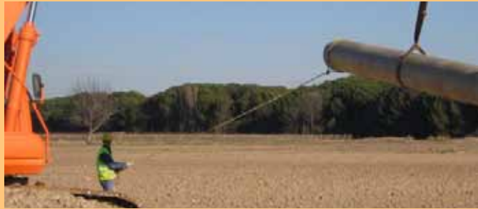
Fig. 60. Manejo de la tubería mediante cabos de gobierno.