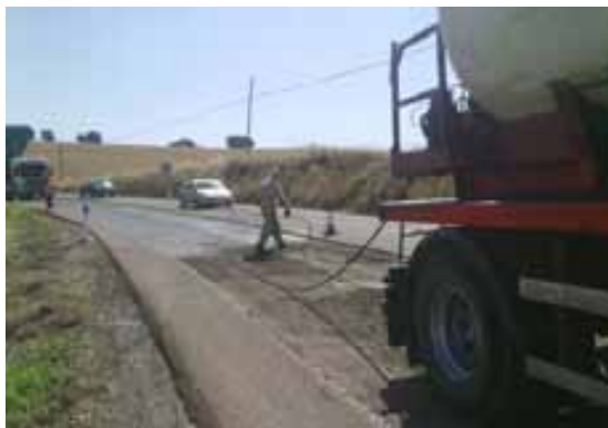
Fig.94. Equipos de protección individual

El personal irá provisto de ropa de trabajo de alta visibilidad dotada de elementos retroreflectantes, guantes y botas de seguridad, así como polainas y peto cuando puedan recibir proyecciones o vertidos de aglomerado en caliente, además de mascarillas de seguridad.