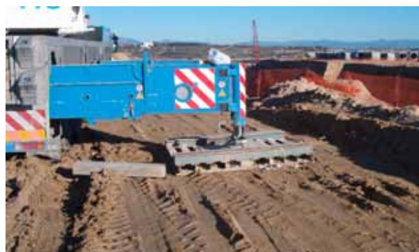
Fig. 117. Gatos de apoyo y reparto de cargas.

Es necesario informar a los trabajadores que puedan verse afectados por los riesgos de caída o golpes de objetos, disponer la señalización informativa de aviso de cargas suspendidas y adoptarse las medidas oportunas de balizamiento, etc., para evitar que personal no autorizado acceda a la posible zona de batido de cargas.