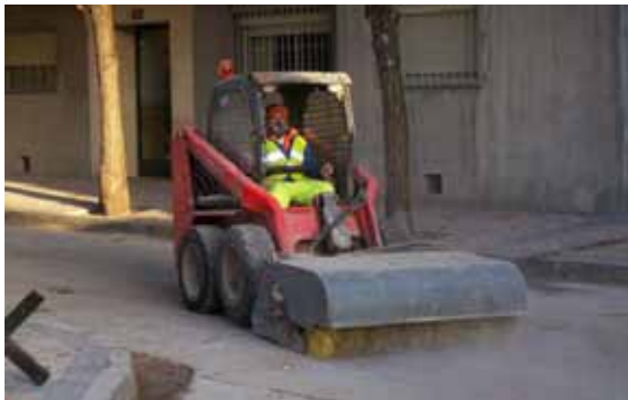
Fig.95. Uso de mascarilla como equipo de protección frente a la existencia de polvo.

Las operaciones de descarga de materiales en el tajo, así como las de aproximación y vertido de productos asfálticos sobre la tolva de la extendidora, estarán siempre dirigidas por un especialista con el fin de evitar la presencia en su área de influencia de personas ajenas a esta operación.