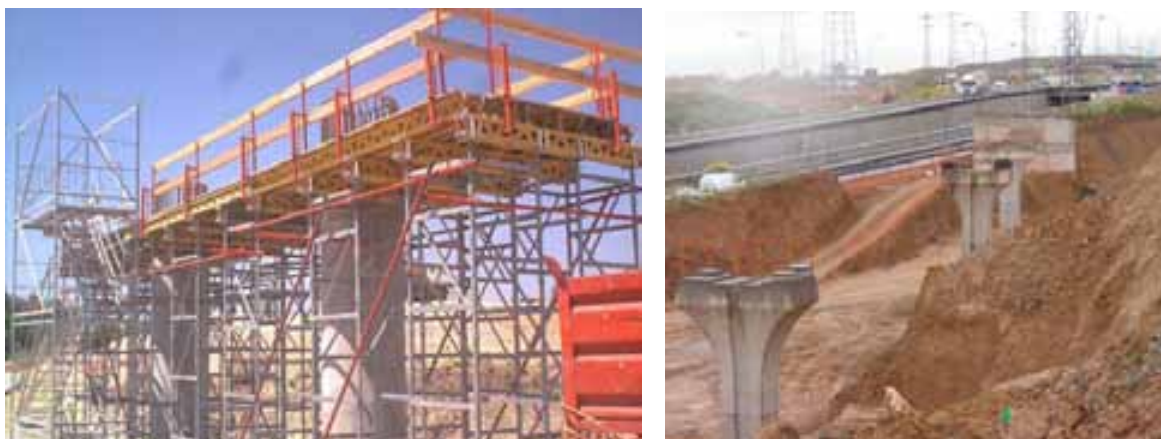
Fig. 75. Protección perimetral en cimbra y acceso con andamio. Barandillas para replanteo, colocación de neoprenos, etc.