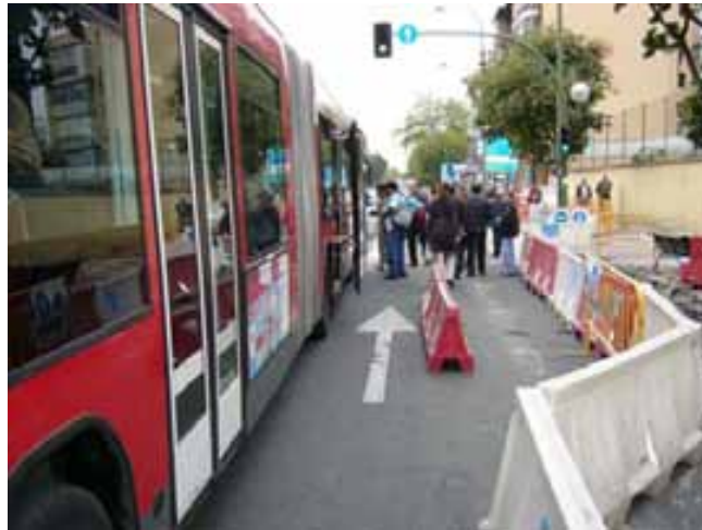
Fig.107. Balizamiento y señalización de paradas de autobús

que los peatones puedan acceder a sus distintos destinos sin tener que atravesar zona de obras ni verse expuestos a los riesgos de las mismas.