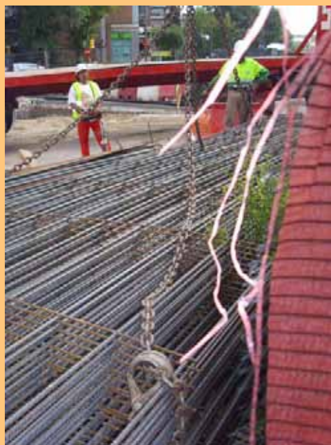
Fig. 20. Desplazamiento de la ferralla con ganchos con pestillo de seguridad. Se debe garantizar la rigidez del punto de amarre.