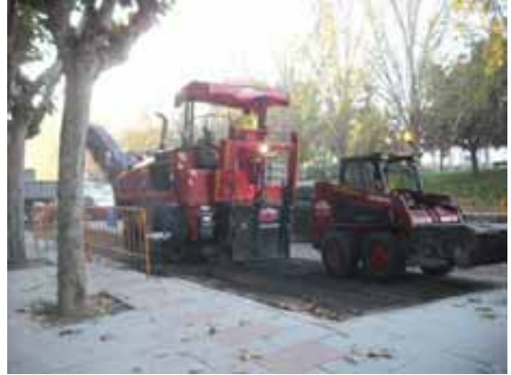
Fig.92. Rotativos luminosos y avisador acústicos

Los equipos de trabajo es importante se adecuen a las características de las zonas a actuar.