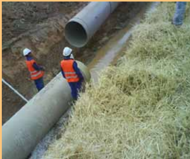
Fig. 61. Posición correcta de los trabajadores durante el solape de dos tramos de tubería