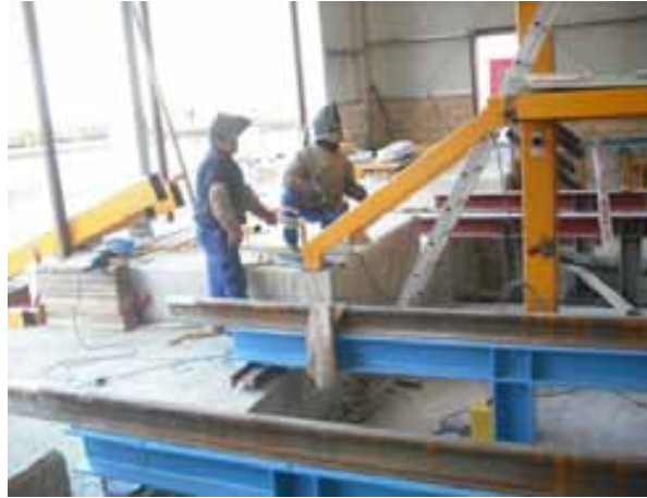
Fig. 84. Trabajador y ayudante en las labores de soldadura deben contar con las protecciones necesarias (pantallas con cristales inactínicos o filtrantes, adecuados a la intensidad de la radiación, mandiles de cuero, manga larga,...).