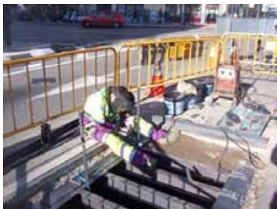
Fig. 86. Utilización de mandil de cuero, polainas, pantalla con cristal inactivo o filtrante.

En relación con la presencia de agua durante los trabajos de soldadura eléctrica, se indican las siguientes prescripciones como requisitos mínimos a desarrollar por las empresas responsables que ejecutan las obras: