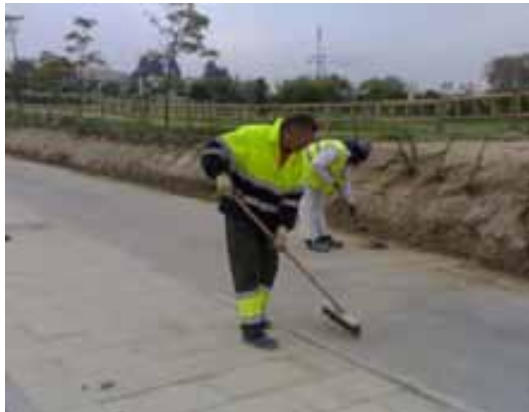
Fig. 102. Trabajos de limpieza. Uso de epi's. Protecciones mantenidas.