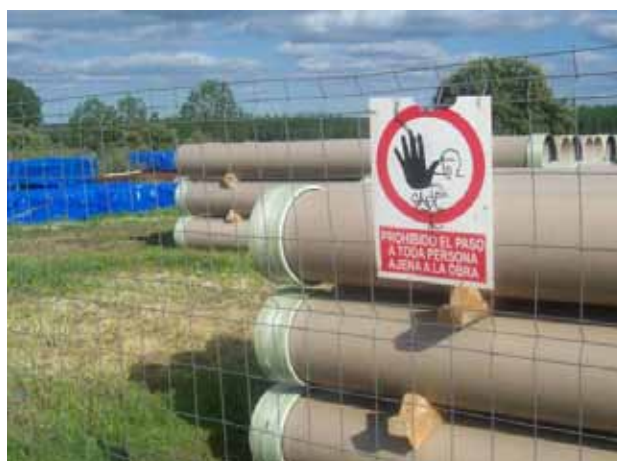
Fig. 59. Señal de prohibición y acopio de material a no mas de 2m de altura.

Durante el montaje de tubería nos encontrarnos también los riesgos derivados de la manipulación de los tubos y su puesta en el interior de la zanja condicionados y caracterizados muchas veces por las reducidas dimensiones de la zanja que limitan la movilidad del trabajador. Como aspectos y medidas preventivas de relevancia destacamos las siguientes: