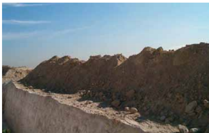
Fig. 24. Situaciones incorrectas de acopio de materiales o posicionamiento de maquinaria.