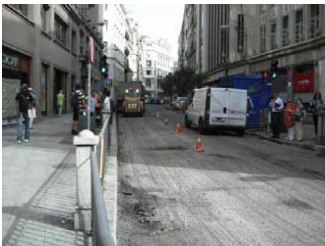
Fig.90. Balizamiento de la zona de actuación

Las máquinas que originen riesgos derivados de la movilidad de las mismas deberán permitir una visión completa del operador en todo el entorno de la máquina. Aquellos movimientos en los que el operador no tenga visibilidad de la zona en la que se mueve deberán estar avisados para evitar los riesgos de atropellos a los trabajadores situados en el entorno. De esta forma, estas máquinas deberán equiparse con un avisador acústico de movimiento. El avisador habrá de ser perceptible dentro del ruido del entorno.