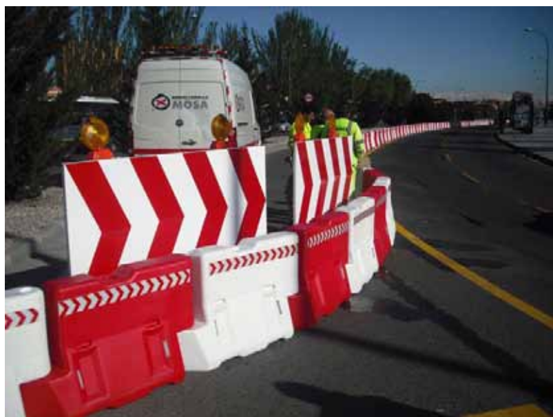
Fig. 109. Señalización luminosa nocturna, reflectancia de señales y balizamiento