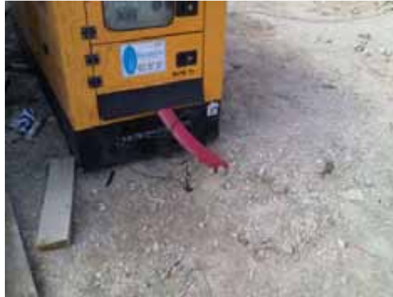
Fig. 8. Canalización enterrada para protección de cableado. Toma de tierra.

Igualmente, es importante que las conexiones se realicen mediante el uso de las clavijas correspondientes, mediante petacas y elementos homologados y adecuados a la tensión utilizada, nunca mediante puntas de cable peladas.