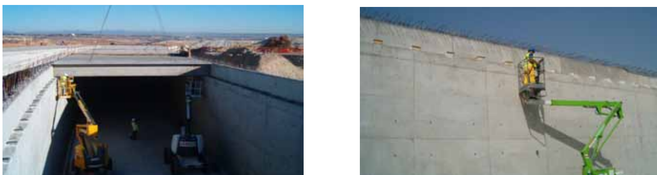
Fig. 76. Empleo de plataformas elevadoras para la colocación de neoprenos y para el guiado del apoyo de las vigas.