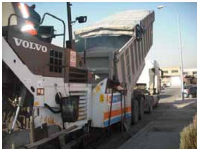
Fig. 96. Vertido sobre tolva sin presencia de personal ajeno en las proximidades