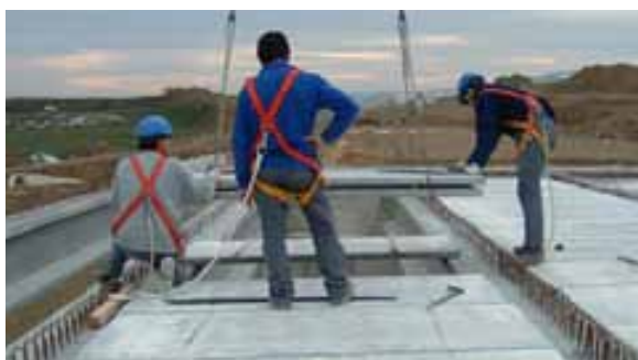
Fig. 80. Uso arnés y línea de vida para los trabajos de colocación de prelosas.

tales como redes bajo la estructura colocadas previamente, o por lo menos en- ganchados a líneas de vida colocadas previamente al izado en el eje de las vigas.