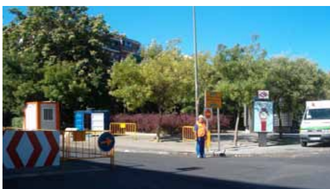
Fig. 106. Control y regulación del acceso mediante señalista, balizamiento y señalización para tráfico rodado y maquinaria