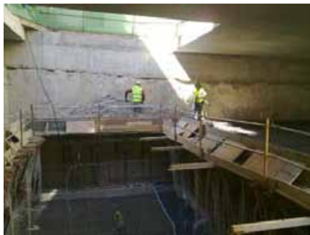
Fig. 64. Barandilla perimetral de protección en borde de forjado.

El acceso y las zonas de trabajo de ferrallado deben encontrarse protegidas previamente con protecciones colectivas para evitar el riesgo de caída en altura si es preciso.