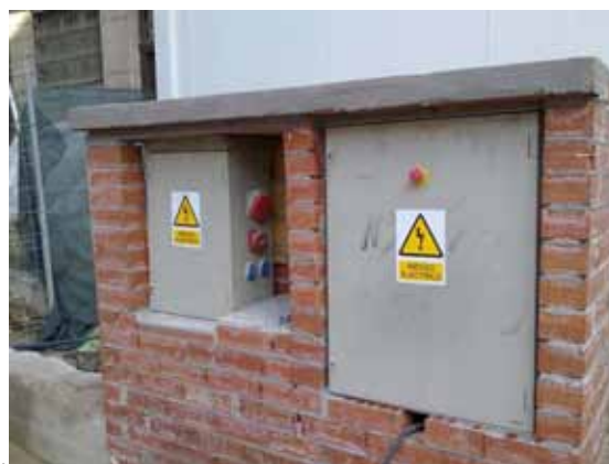
Fig 7. Cuadros eléctricos situados en altura, cerrados y con protección. Toma de tierra y señalización de riesgo eléctrico.

Con carácter particular, se adoptarán las medidas pertinentes para impedir daños a las conexiones y cables evitando su afección por el tráfico rodado y por la maquinaria de sus inmediaciones, por ejemplo mediante el paso del cableado por canalizaciones enterradas, en tendido aéreo o protegidos con chapones o tabloncillos.