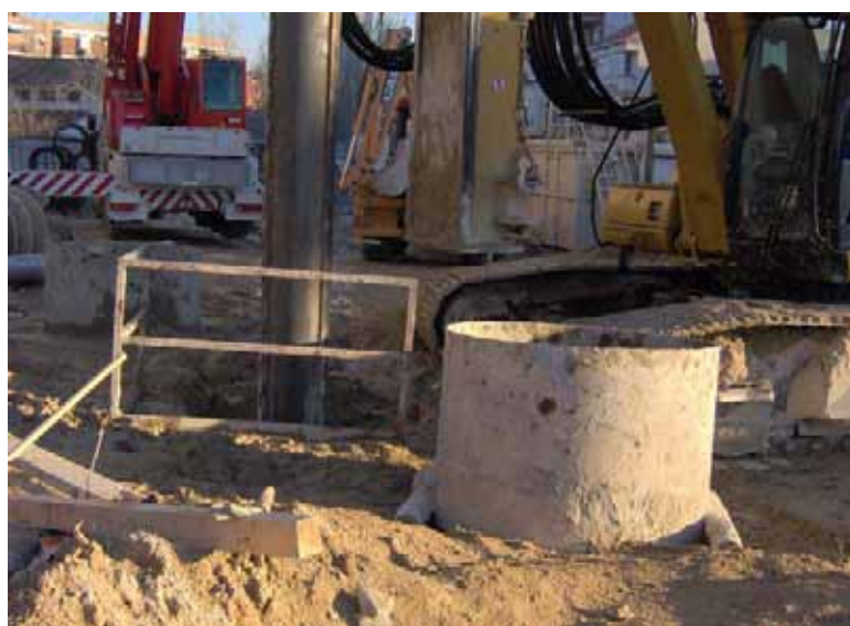
Fig 56. Excavación con barandilla en L y brocal para colocación de armadura y hormigonado.