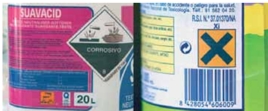
Fig.110. Pictogramas de señalización de la peligrosidad del producto

Producto químico peligroso: producto químico que debido a sus propiedades fisicoquímicas, químicas o toxicológicas, pueden durante la fabricación, manejo, transporte, almacenamiento o uso generar o desprender polvos, humos, gases, líquidos, vapores o fibras infecciosas, irritantes, inflamables, explosivos, corrosivos, asfixiantes, tóxicos o de otra naturaleza peligrosa, o radiaciones ionizantes en cantidades que puedan afectar la salud de las personas que entran en contacto con estas, o que causen daño material.