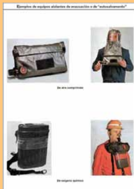
Fig. 33. Equipo de rescate y autosalvamento.