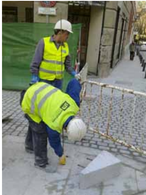
Fig. 104. Bolardos. Balizamiento zona de actuación y uso de epi's.

Igualmente, es importante que la manipulación de las cargas se realice utilizando medios auxiliares específicos que eviten las sobrecargas y que en estos casos se tomen las medidas preventivas previstas en la planificación preventiva de cada obra en relación con la manipulación de cargas con medios mecánicos, debiendo planificarse el enganche de las cargas con puntos específicos para el izado de las mismas y con elementos de sujeción adecuados para las cargas a soportar, prever los equipos auxiliares para el enganche y desenganche, prohibición de permanencia en el radio de acción de las cargas, etc.