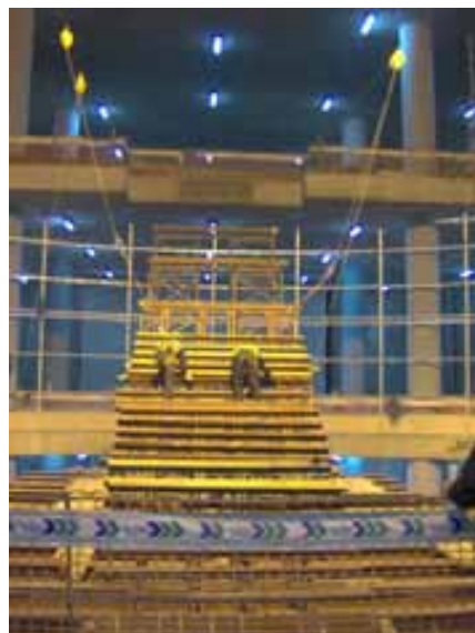
Fig. 15. Montaje de cimbra de escalera con línea de vida superior y utilización de arnés con bloque retráctil