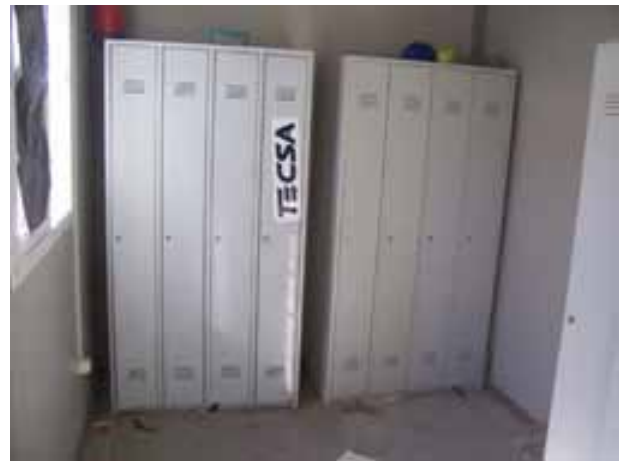
Fig. 6. Taquillas y mesa para comedor