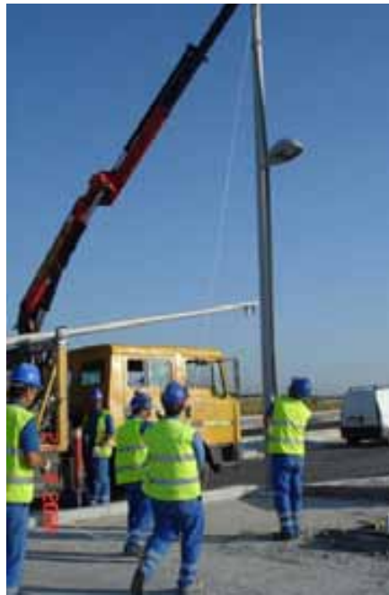
Fig. 118. Utilización de cuerda atada al pestillo de seguridad para deslingado del soporte.

Con carácter particular, para los trabajos de colocación de soportes de alumbrado , se recomienda el uso de una cuerda atada al pestillo de seguridad para abrirlo y evitar tener que ascender para desenganchar la eslinga del soporte. En el caso de que sea necesario ascender, se dará prioridad al uso de andamios y plataformas elevadoras ante el empleo de escaleras, siempre valorando el nivel de riesgo.