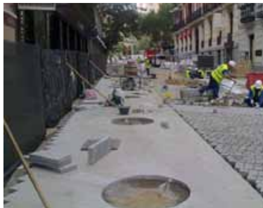
Fig. 87. Trabajos de solado en vía pública.

La manipulación manual de estas cargas genera un número importante de posturas forzadas y movimientos repetitivos (agacharse, arrodillarse,...) y por consiguiente una elevada exposición al riesgo .