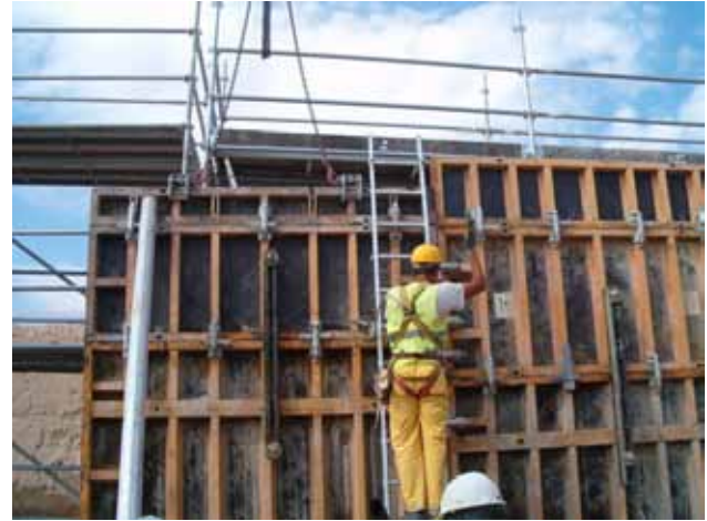
Fig. 65. Trabajos de montaje de paneles de encofrado mediante plataforma elevadora o escalera y arnés de seguridad.

Ante el riesgo de desplome del encofrado dispuesto, es preciso que se designe a un Técnico competente que será el encargado de supervisar y dirigir las operaciones de montaje, utilización y desmontaje, así como de elaborar o acreditar la existencia de los cálculos que garanticen su resistencia y estabilidad. Igualmente, deberá asegurarse la estabilidad tanto del conjunto del encofrado como de todas y cada una de las partes del encofrado que se van montando (en todas y cada una de las fases).