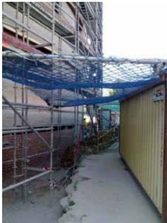
Fig. 38. Pasos protegidos contra el riesgo de caída de objetos en altura.

Previamente al inicio de las actividades será necesario delimitar la zona de actividades mediante un vallado adecuado (simple torsión, cerramiento de chapas, vallas Julper, etc.), de modo que en ningún momento pudiera acceder al recinto de la obra personal no autorizado.