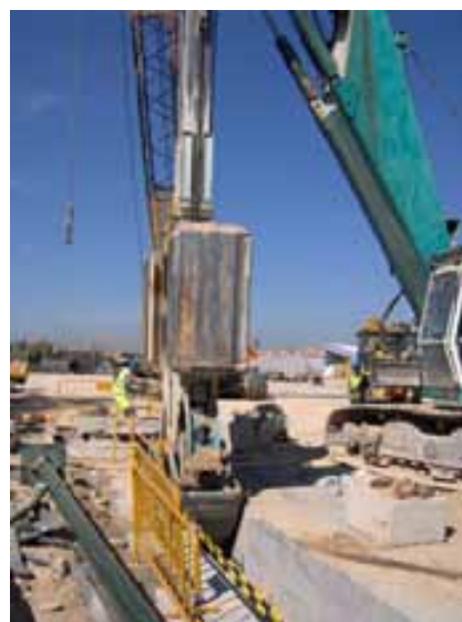
Fig. 47. Pantalladora de bastidor rígido y vallado en el lado opuesto de la pantalladora. Dados de hormigón como puntos fijo para anclaje de arnés de seguridad con bloque retráctil.