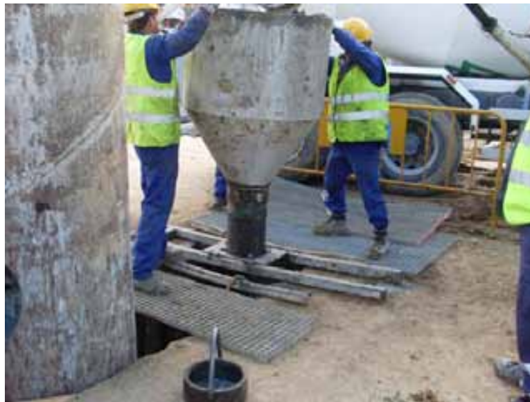
Fig. 52. Protección para hormigonado con tramex, complementada con vallas tipo ayuntamiento.