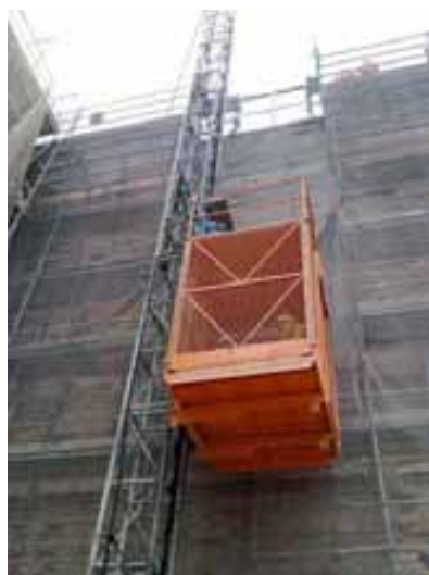
Fig. 73 Vista de ascensor para acceso de personal.

Es importante prever cómo se va a acceder a la cubierta, disponiéndose en caso preciso los medios auxiliares necesarios para el acceso seguro a la misma.