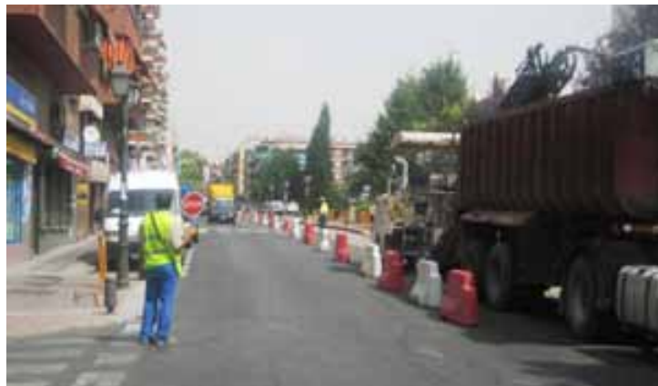
Fig. 98. Operario de apoyo

Es importante que se estudie con detenimiento las posibles zonas de espera para la maquinaria cuando no se esté trabajando, así como los accesos para los camiones de aglomerado y las máquinas a los distintos tramos de trabajo . Para ello es necesario contar con operarios de apoyo a la maquinaria que se posicionarán siempre de cara a la circulación de la carretera y manteniendo una distancia de seguridad con los carriles de circulación de los vehículos.