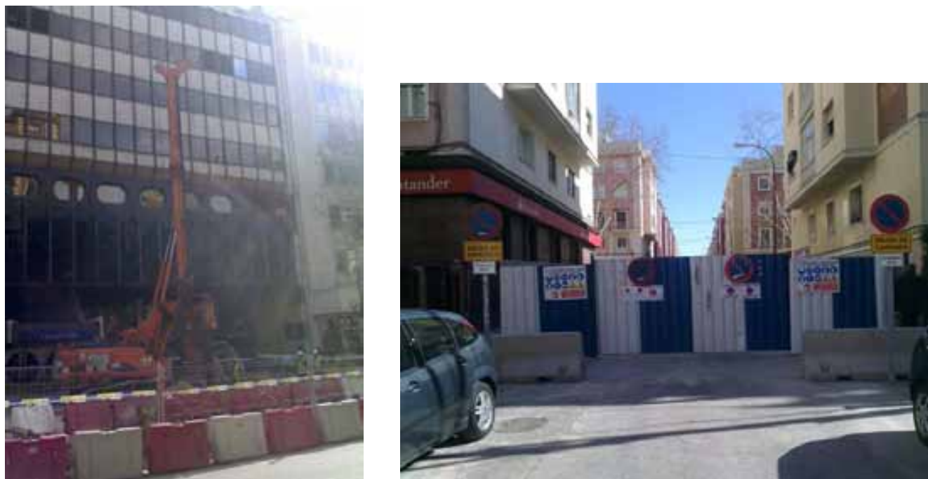
Fig. 39. Delimitación de obra mediante valla metálica o de plástico.

Es importante habilitar accesos adecuados al recinto de trabajo, realizando un control de acceso vigilado por los mismos. Estos accesos deberán estar claramente diferenciados (uno para peatones y otro para maquinaria), con objeto de evitar interferencias entre la maquinaria y los operarios.