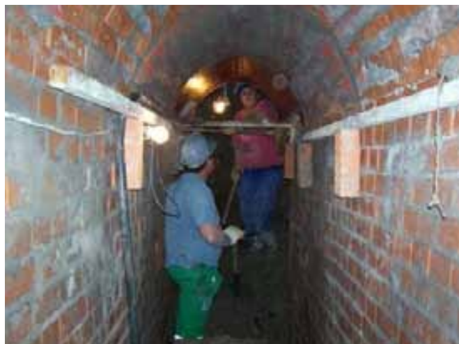
Fig. 34. Trabajadores ejecutando trabajos de revestimiento de un colector mediante fábrica de ladrillo.