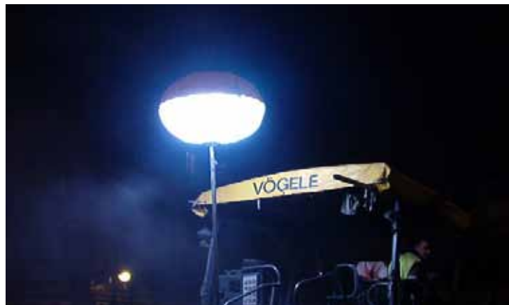
Fig. 100. Iluminación suplementaria adecuada en trabajos nocturnos