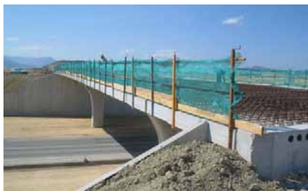
Fig. 82. Barandillas de protección en borde de tablero.