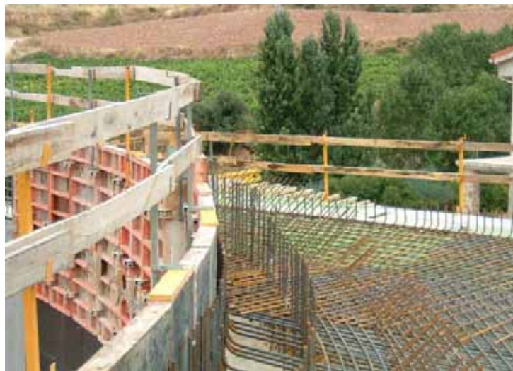
Fig. 16. Barandilla en lateral y frontal de paso inferior ejecutado in situ. Pasillo de seguridad en el frontal.