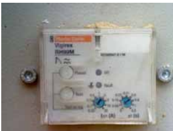
Fig. 9. Parada de emergencia en grupo electrógeno.