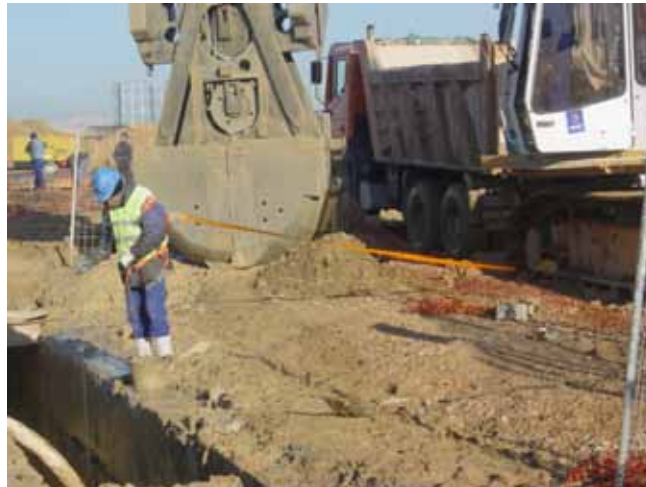
Fig.48. Utilización de arnés de seguridad y bloque retráctil de cinta para aproximación al batache abierto y medición de la profundidad de la pantalla.

evitar esta medida a no ser que sea estrictamente necesario y previa justificación del punto de anclaje del arnés de seguridad.