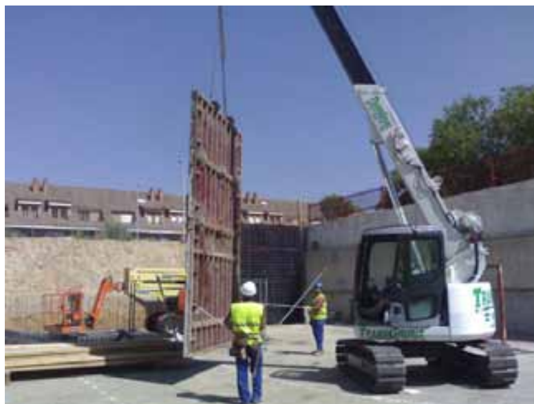
Fig. 113. Manipulación de cargas en altura.

Es importante que no se transite bajo cargas suspendidas , utilizando cuando sea necesario cabos de gobierno para el guiado de las mismas y evitando en todo momento la proximidad de trabajadores a los elementos manipulados.