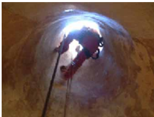
Fig. 35. Ascenso y descenso mediante línea de vida y arnés de seguridad.