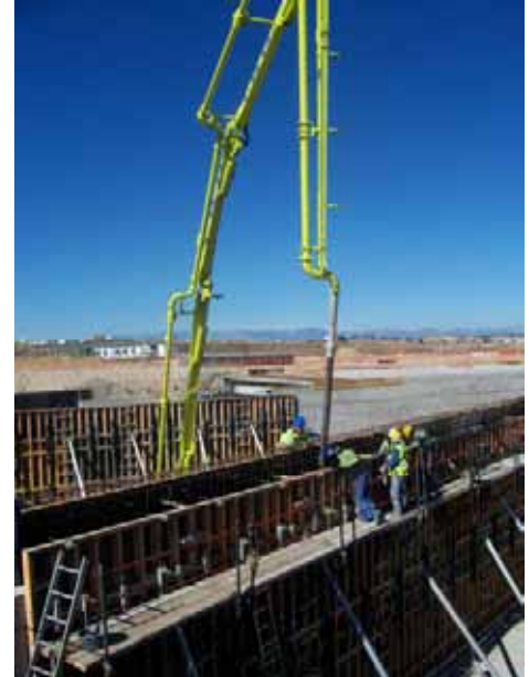
Fig. 68. Acceso al lugar de hormigonado mediante andamio o escalera.

En el uso de plataformas de hormigonado es importante prever si el propio encofrado puede servir como elemento de protección, o si es preciso disponer según el fabricante una barandilla sujeta en el panel de encofrado del trasdós, colocar otra plataforma al otro lado o instalar una línea de vida a la que engancharse los trabajadores, anteponiéndose las dos primeras opciones a la tercera.