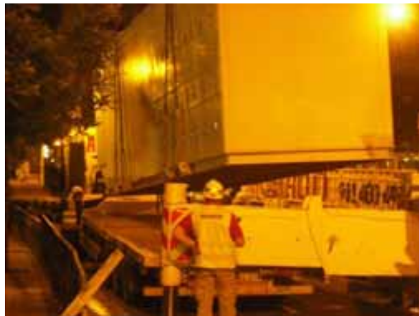
Fig. 1. Recurso preventivo durante el movimiento de prefabricados pesados (centro de transformación).