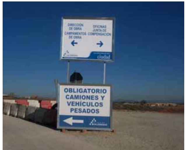
Fig. 26. Carteles y señales en el interior de la obra.