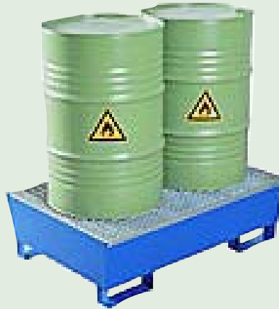
Fig.112. Cubetas de recogida de posible material derramado.