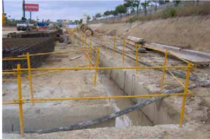
Fig. 51. Barandilla en la excavación con línea de vida. Barandilla en murete guía tras el hormigonado.