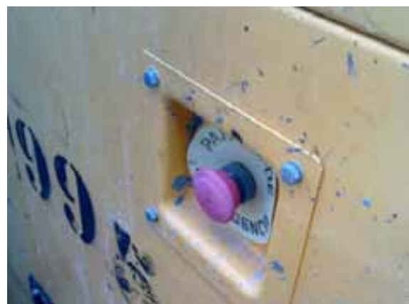
Fig. 10. Diferencial de 0,03 A.