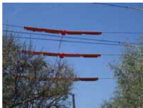
Fig. 41. Ejemplos de pórtico de limitador de altura, señal de riesgo eléctrico y protectores de línea.