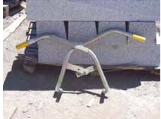
Fig. 89. Ejemplos de útiles para la colocación de bordillos

Análogamente, se recomienda considerar las siguientes prescripciones preventivas: