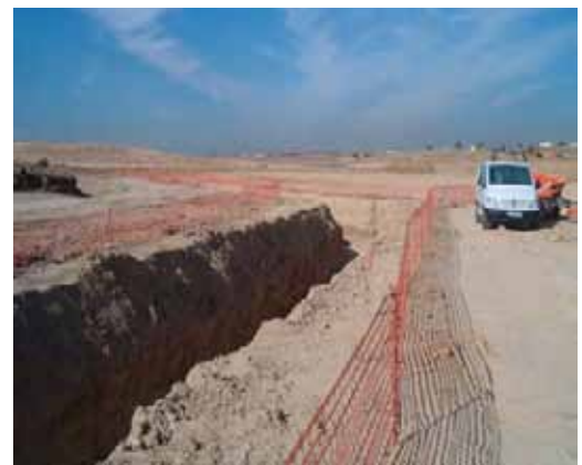
Fig. 23. Balizamiento de borde de excavaciones y desniveles