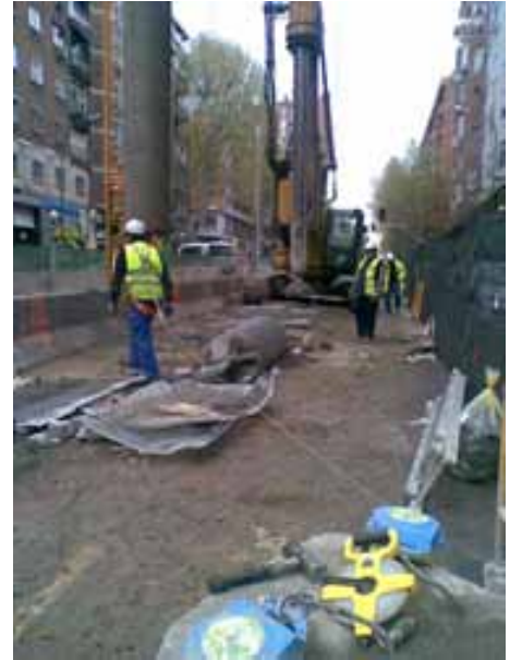
Fig. 44. Enganche mediante sistema retráctil