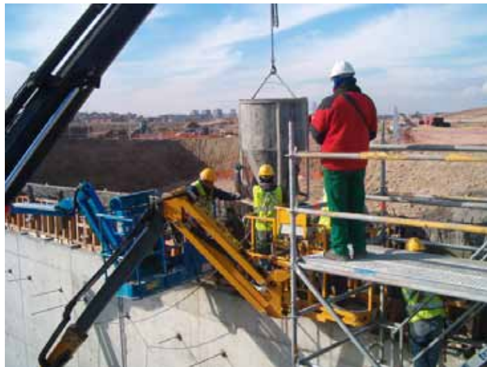
Fig. 66. Uso de equipos de auxiliares seguros para la ejecución del hormigonado de elementos en altura (cestas elevadoras, andamios).

De manera general, es importante que se organicen los trabajos de manera que el personal no permanezca en el radio de acción de la maquinaria, que se revise el estado de los encofrados para evitar reventones de los mismos que puedan producir derrames o incluso el colapso de la estructura montada y que en los casos en que existen cargas suspendidas, estas no pasen sobre los trabajadores.