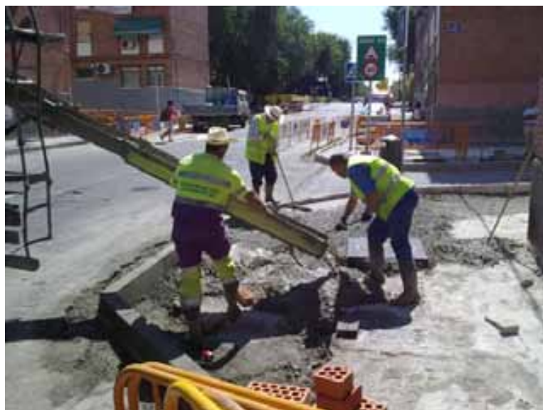
Fig. 17. Utilización de sombreros de a la ancha para protegerse del sol.