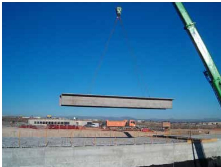
Fig. 116. Manipulación de carga por puntos de amarre concreto y previstos para ello.

Es importante también que el trabajador encargado del amarre de los materiales se cercioren de que los elementos utilizados para el amarre (eslingas, cadenas, ganchos, etc.) están perfectamente asegurados antes de dar la orden de movimiento al grúa.