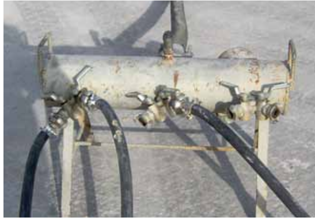
Fig. 54. Calderín de reparto de martillo compresor para varios martillos neumáticos.