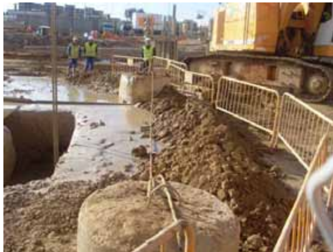
Fig. 45. Línea de vida sobre dados de hormigón en el lado opuesto de la pantalladora. Los dados de hormigón pueden utilizarse de forma independiente como puntos fijos o con línea de vida entre dos de estos dados.