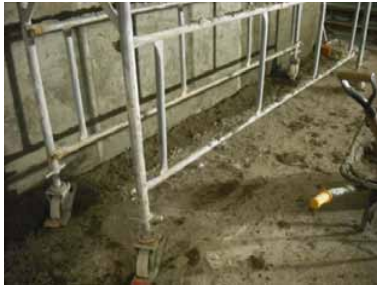
Fig. 12. Trabajos desde módulo de andamio con frenos accionado