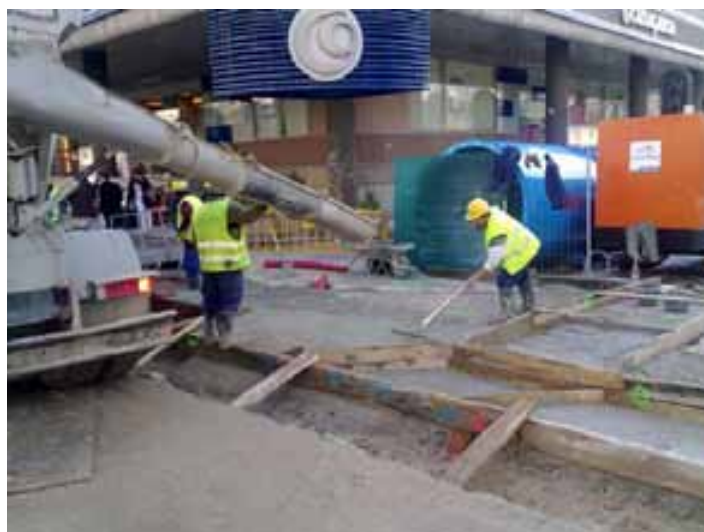
Fig. 67. Utilización de botas de seguridad altas para trabajos de hormigonado.