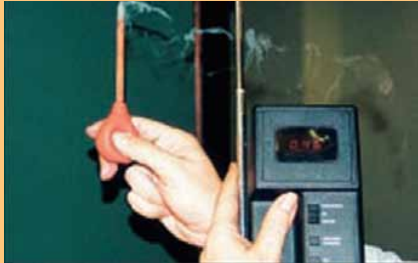
Fig. 32. Toma de mediciones del aire.