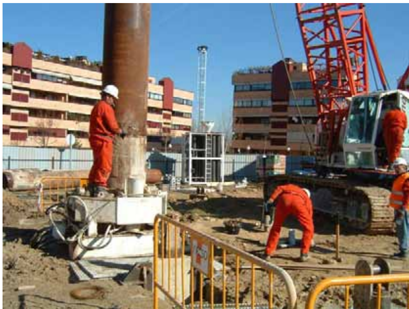
Fig. 53. Extracción de junta de pantalla con mesa hidráulica