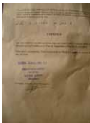
Fig. 11. Ejemplos de certificación de andamio a pie de obra