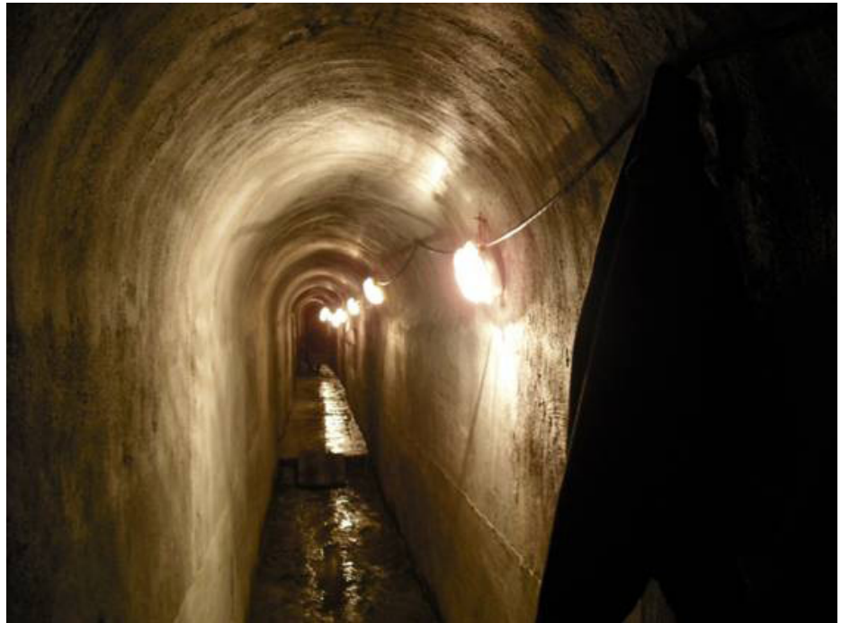
Fig. 30. Vista de las características de un colector.