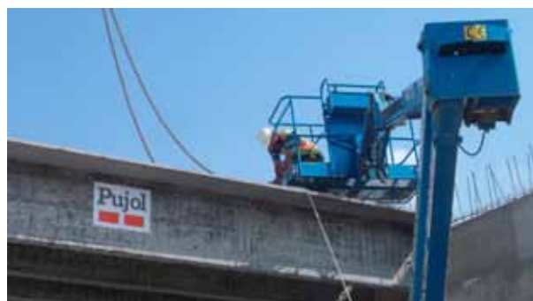
Fig. 77. Uso de plataforma elevadora para trabajos de deslingado de las cargas en altura.

Es importante durante los trabajos de montaje de vigas prefabricadas, que se planifique la utilización de medios auxiliares tales como plataformas elevadoras para los trabajos de desenganche una vez colocadas en su posición, así como para los trabajos de guiado y apoyo de las vigas en los estribos o pilas.