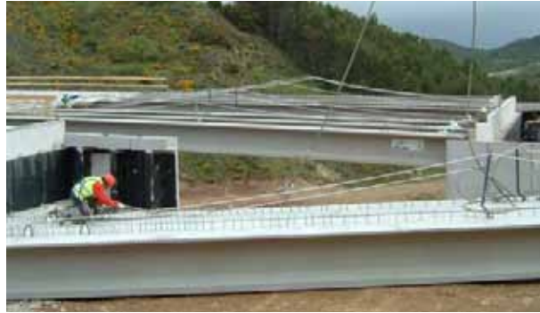
Fig. 78. Uso de protecciones individuales para trabajos de eslingado de la carga a la grúa

En caso de no ser posible utilizar plataformas elevadoras, es preciso colocar las protecciones, colectivas en primer lugar o individuales en caso de imposibilidad técnica, con anterioridad a su izado.