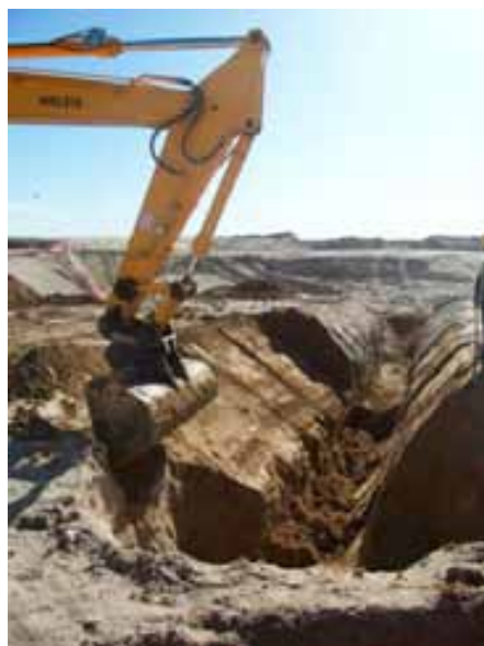
Fig. 21. Taluzado y refino de coronación de talud

En la misma línea, la elección del procedimiento de ejecución será fuente de diferentes riesgos o de diferencia de magnitud de los mismos. Es por ello, que en la planificación del proceso constructivo deberán tenerse en cuenta los principios de acción preventiva para definir procesos que integren la seguridad en origen.