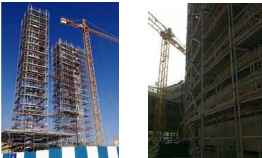
Fig. 69. Vista de andamios perimetrales para trabajos en altura.

Para la ejecución de estos trabajos, es importante la utilización de los medios auxiliares más adecuados según los trabajos a ejecutar para evitar el riesgo de caída en altura, entre otros, plataformas elevadoras, andamios, cimbras y escaleras.