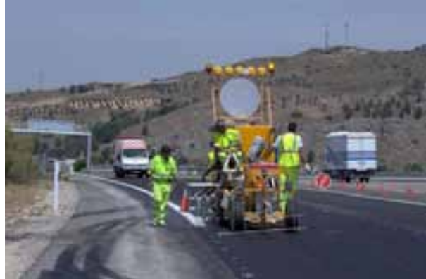
Fig. 101. Señalización horizontal con pintabandas. Vehículos de protección.

Los trabajos que se realicen con afección al tráfico, hay que considerar que la zona de trabajo esté separada físicamente de la zona de circulación de la carretera mediante la señalización y el balizamiento correspondiente, planificándose si es precisa la colocación de un vehículo de protección con rotativo luminoso y/o panel luminoso encendido en su parte posterior como protección.