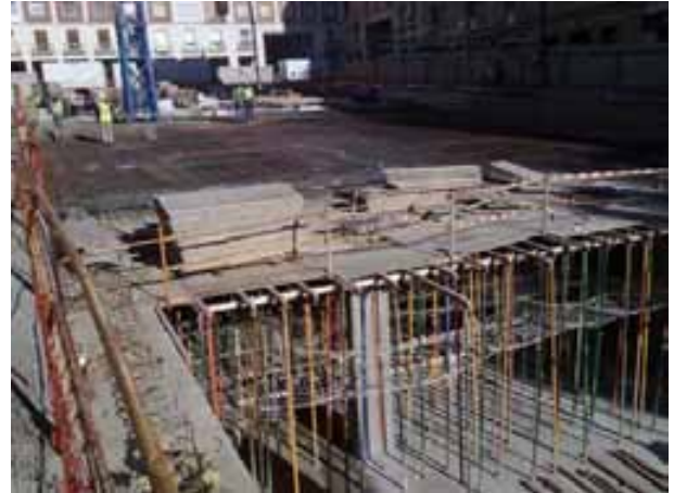
Fig. 74. Ejemplos de protecciones colectivas en trabajos de forjado.

Igualmente, es preciso tener en cuenta el canto del forjado a la hora de disponer las protecciones de borde o disponerlas fuera del límite del forjado, de manera que continúen siendo útiles para los distintos trabajos posteriores.