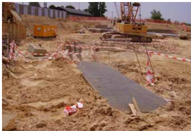
Fig. 49. Batache tapado con trámex y mesa de hormigonado con el hueco del tubo tremie para hormigonar. Fig. 50. Tramex para tapar todo un batache