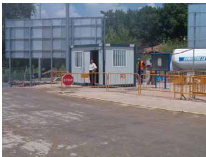
Fig. 40. Vista de un control de acceso a obra.

Es importante habilitar accesos adecuados al recinto de trabajo, realizando un control de acceso vigilado por los mismos. Estos accesos deberán estar claramente diferenciados (uno para peatones y otro para maquinaria), con objeto de evitar interferencias entre la maquinaria y los operarios.