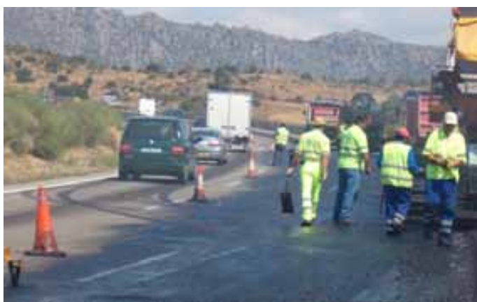
Fig. 97. Trabajadores de a pie, fuera del radio de acción de la extendidora.