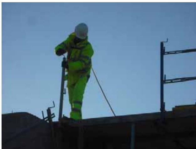
Fig. 70. Colocación de barandilla de protección mediante arnés de seguridad para evitar el riesgo de caída en altura.

Es importante prever cómo se van a colocar dichas protecciones colectivas, y si es preciso utilizar equipos de protección individual para su colocación, debiendo disponerlas siempre que sea posible previamente a que exista el riesgo.