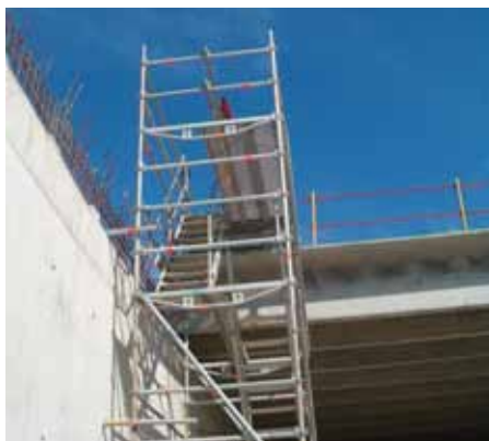
Fig. 81. Vista de una escalera andamiada para acceder al tablero.

Para la ejecución de los trabajos en los tableros, es importante que se planifi- quen los accesos al mismo, anteponiéndose el uso de escaleras andamiadas al empleo de plataformas elevadoras o escaleras de mano.