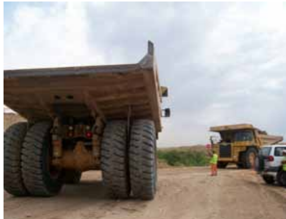
Fig. 22. Movimiento de maquinaria de obra auxiliada por un señalista.

Análogamente, tiene especial relevancia evitar que la maquinaria se aproxime al borde de excavaciones, zanjas y terraplenes ya que los bordes son la zona más inestable. Por ello, es aconsejable en los trabajos de relleno y vertido generar un pequeño caballón de tierras , previo al borde del vaciado como tope para delimitar la aproximación del camión así como el auxilio de los movimientos por un señalista.