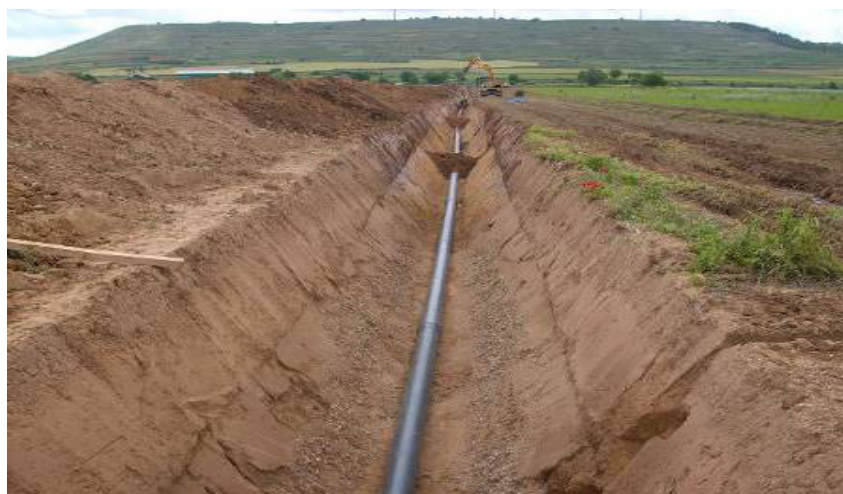
Fig. 58. Ejemplo de colocación de tubería en interior de zanja.

Se pretende a continuación, determinar las pautas a seguir para la adecuada colocación de tuberías en zanjas, ya sean de fundición, PVC, fibrocemento, hormigón o polietileno, en zona urbana, con sus peculiaridades derivadas de la existencia de servicios que se verán afectados, o en zonas no urbanas.