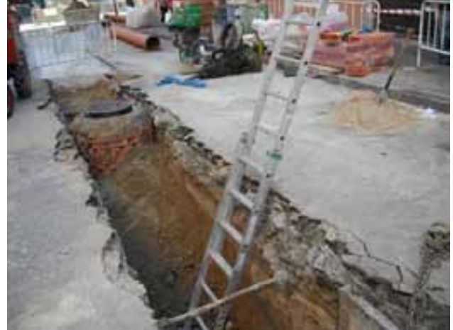
Fig. 25. Escaleras de acceso a las excavaciones, 1m por encima del punto de desembarque.