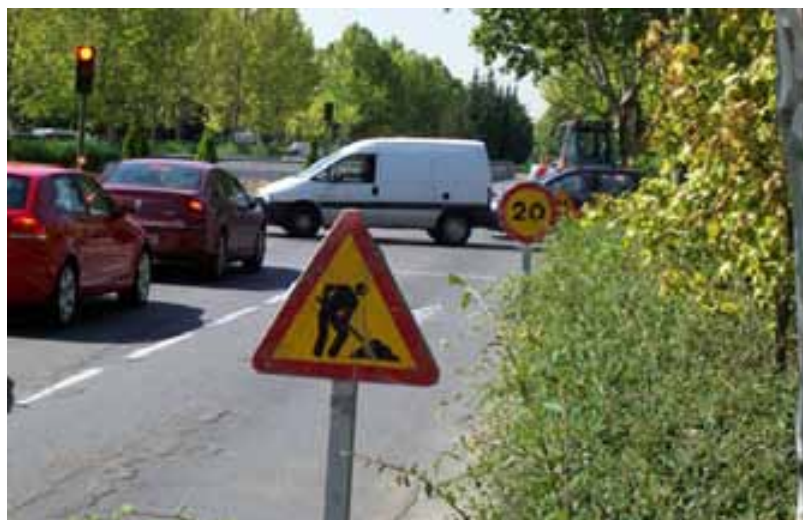
Fig. 108. Señalización de la obra y cruces antes de la zona delimitada