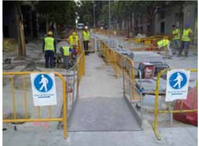
Fig. 37. Señalización, pasarelas y pasillos por el paso de peatones.

Cuando exista el riesgo de caída de materiales sobre terceros o trabajadores, se deberán disponer pasillos protegidos, con protecciones tales como marquesinas o redes.