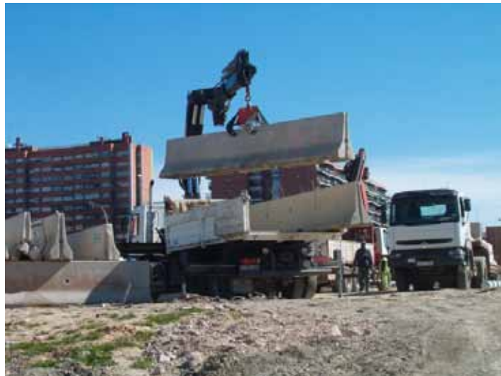
Fig. 115. Ejemplos de útiles para la sujeción de piezas.

Es preciso que los elementos dispongan de puntos concretos previstos por el fabricante para su enganche.