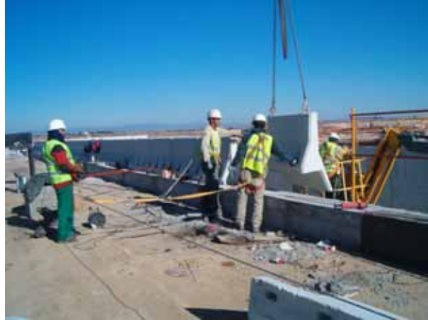
Fig. 71. Ejemplo de uso de equipos de protección individual cuando se ha retirado la protección colectiva.

Cuando sea necesario realizar trabajos en el borde de elementos en altura que impliquen la retirada de las barandillas de protección se dispondrá de protección colectiva (redes de seguridad) o de los equipos de protección individual (línea de vida o puntos fijos de anclaje y arnés de seguridad) adecuados a tal efecto.