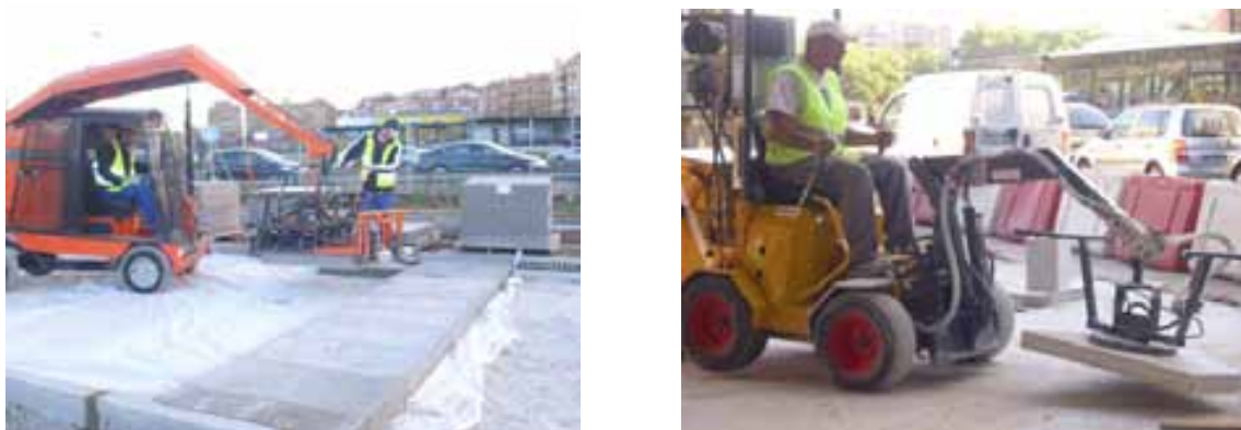
Fig. 88. Colocación de losas mecanizada

Como norma general, la mejor práctica para evitar riesgos de lesiones en trabajos de solado y bordillo, es evitar la manipulación manual de cargas a través de la automatización de la misma , analizando siempre los nuevos riesgos que se puedan generar y evitar una larga exposición del trabajador a operaciones que requieren esfuerzo físico o posiciones incómodas (agachadas, encorvadas o con movimientos vibratorios).